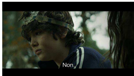
Le mensonge pour cacher sa véritable identité.