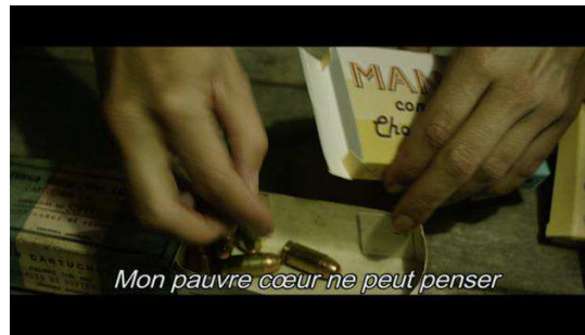
Des caches d'armes pour être prêts à l'action armée.