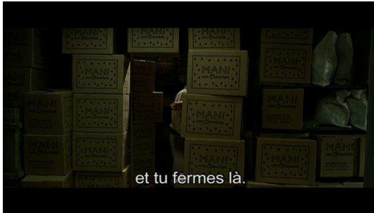
Une cachette en cas d'urgence.

On peut ensuite demander aux élèves de relever les éléments du film qui montrent la clandestinité des personnages. On peut aussi leur demander de légénder des images extraites du film (voir exemples ci-dessous).