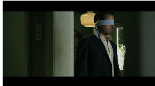
Chacun en connaît le moins possible pour éviter les dénonciations.