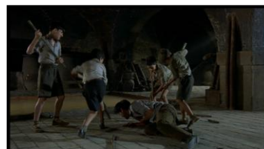
La « horde primitive »