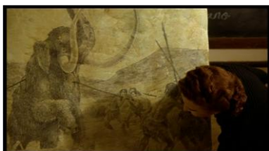
Les chasseurs de mammoth