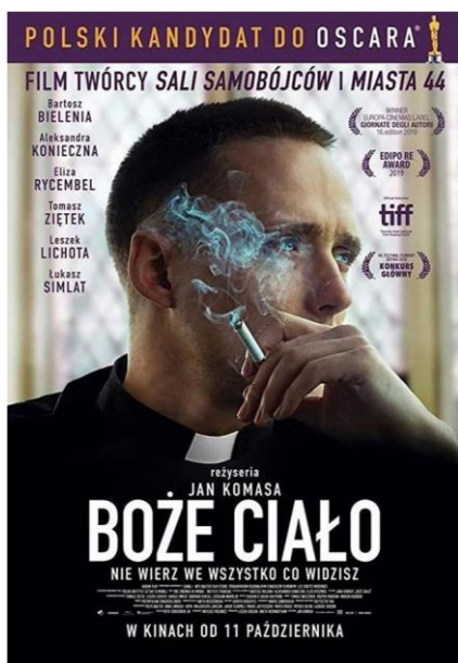
Affiche polonaise, la traduction littérale du titre du film est « Corpus Christi »