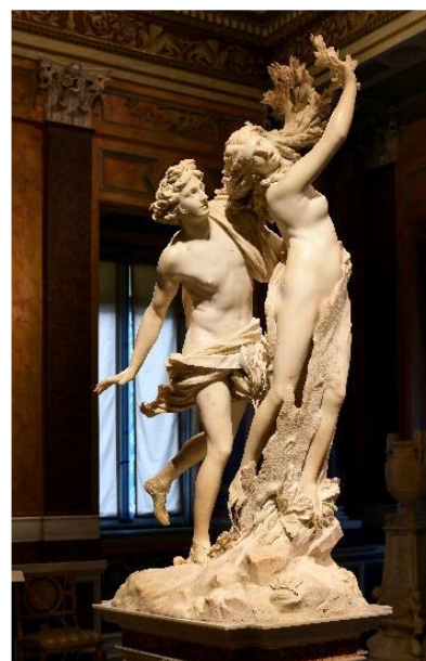
Apollon et Daphné est une sculpture de Bernin (1622-1625) conservée à la Galerie Borghèse à Rome.

Il est aussi intéressant de noter que le prénom de ce personnage est proprement féminin, contrairement à Géraldine, et qu'il raconte les poursuites incessantes que subissent les femmes. S'agit-il aussi de raconter une métamorphose d'un homme en femme ?