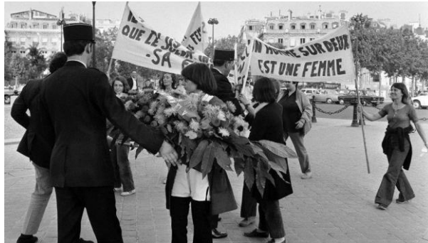
Place de l'Étoile à Paris, le 26 août 1970.

forment un système de violences si ancrés, si incorporé, si intégré, aussi bien individuellement que collectivement, qu'il finit par être transparent, impensé, tabou. Ce système, c'est le patriarcat ». Le film donne ainsi à voir la transparence du système de violences envers les femmes, à travers une comédie qui permet de se voiler la face, de se cacher les yeux comme les musiciens dans la scène de danse, mais elle sert aussi à « corriger les mœurs », ou en tout cas à sortir de l'aveuglement. Le slogan des féministes des années 70, « un homme sur deux est une femme », est déjà à l'œuvre dans ce film.